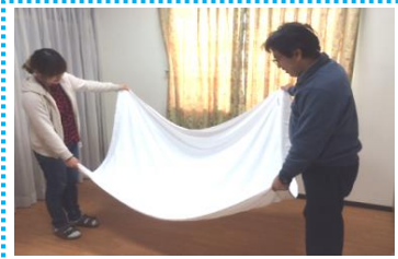
◎室内でおこなうシーツブランコ。複数の子が集まる人気遊びです。