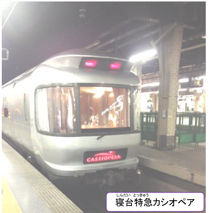
しんだい とつきゅう 寝台特急カシオペア