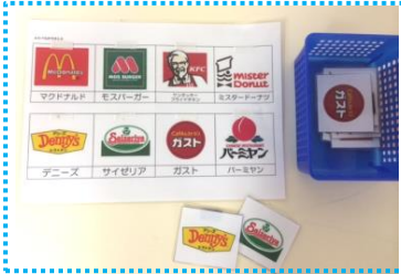
◎お店のロゴマークをマッチさせる遊びにつながりました。