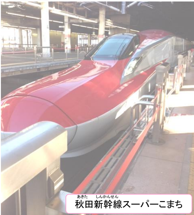
あきた しんかんせん 秋田新幹線スーパーこまち