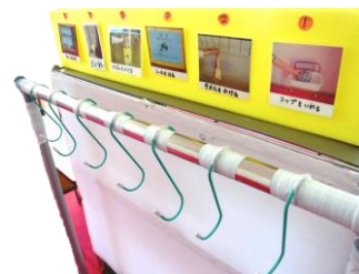
来所持に行う準備を、写真 とフックで示しています