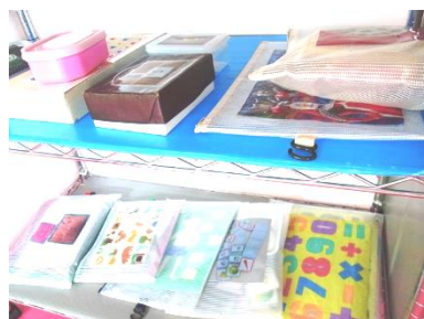
座って手指を 使って遊ぶ グッズ