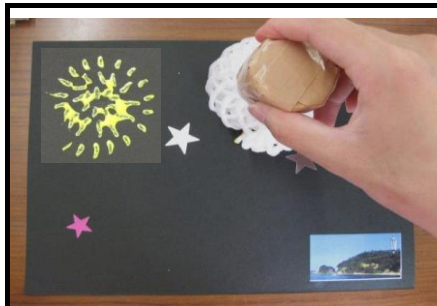
③すたんぷ を おす