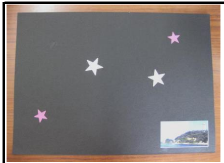
①しーる を はる