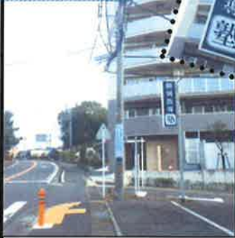
個別指導塾の角を右折