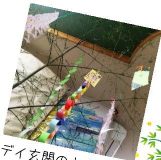
デイ玄関の七夕飾り