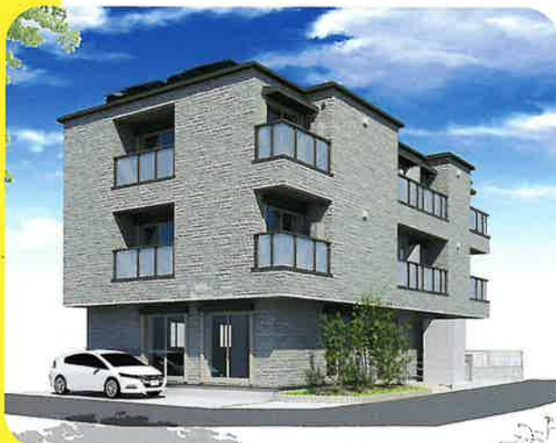
完成イメージ (1階「湘南ジョイフル」 2階以上「スマフル高倉」)

「湘南ジョイフル」は、「野菜」「運動」「健康」をキーワードに、ICT (情報通信技術) 機器の導入や介護予防の観点を取り入れ、新しい形の生活介護事業所を目指します。農作業のお手伝い、受注作業、委託販売、長後駅周辺の清掃など、地域とのつながりを大切にする活動を提供します。