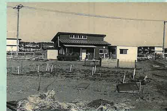
当時の星の村共同作業所

義務教育が終わったあと、一人ひとりにふさわしいプログラムで、喜んで参加できる場をという親たちの願いのもと親たちと共に1978年、「星の村共同作業所」を作りました。仲間と共に、有機農法・無農薬の野菜作りや、版画、機織りなどの作業をしました。