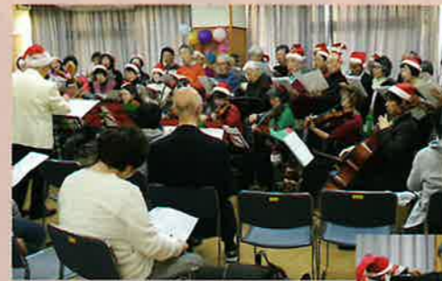
「サンタさんの手品が楽しみ!」「歌が楽しい!」「ケーキが美味しい!」と利用者さんの声。定期演奏会の売上の一部を毎年ご寄付いただいています。

合唱団にはカトリック信者も多く、活動の背景に慈愛の心、感謝の心があると思います。合唱団の定款に、社会事業に取り組むことを盛り込んでいます。利用者さんにとってモーツァルトの楽曲が、社会生活の質の向上になればと思っています。西條さんのご意思にもつながると思いますが、障がいのある方を支えることは社会の役割です。小さなことでも続けることが大事だと思っています。