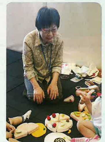
いつも優しいまなざしで活動されています

学校は3年で卒業して、できれば海外旅行にも行きたいです。日本の美術館めぐりや名所めぐりなどもしてみたいです。