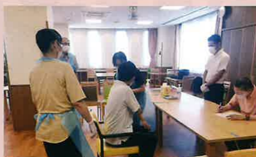
湘南だいちでの接種風景

障がいをお持ちの方が病気やけがなどで医療機関を受診する際、病院でお願いしている手順では治療や検査が難しい場合があります。その方がスムーズに治療を受けるために何が必要か、関係する皆さんで普段から良く話し合い、情報共有しておく事が大切だと思います。