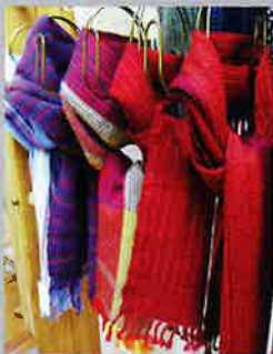
9 織りマフラー 1,800円~3,500円