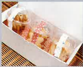
1 あうにーるのサブレ 200円(5枚入り)~ ギフトバックにもできます!