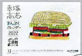
6 アートカレンダー 800円