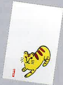
4 はがき(1枚) 100円