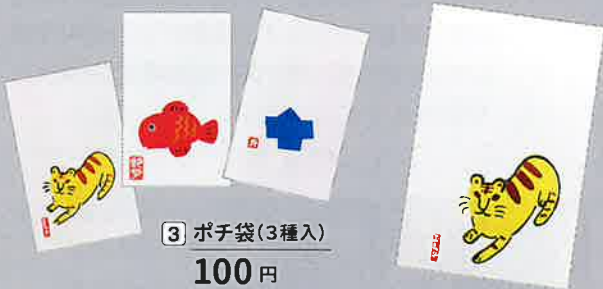
3 ポチ袋(3種入) 100円