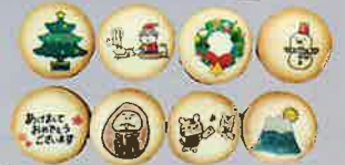
2 だいちの森クッキーギフト 1,000円~ ●6cm サイズ8枚~ ●3cm サイズ16枚~