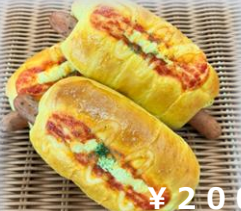
バジルソーセージ