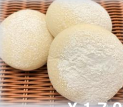
白いクリームチーズ