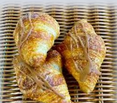
キャラメルクロワッサン