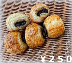
ミニパンオショコラ