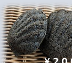
ほうじ茶マドレーヌ