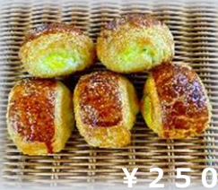
青森ミニりんご カスタード