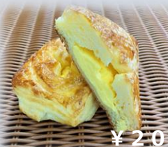
カスタードデニッシュ