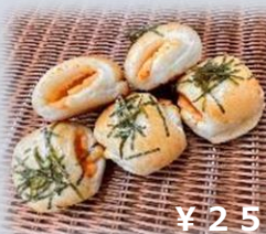
もちっとミニ明太 チーズ