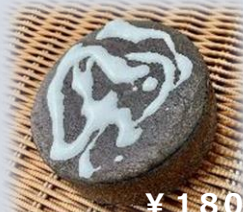
フォンダンショコラ